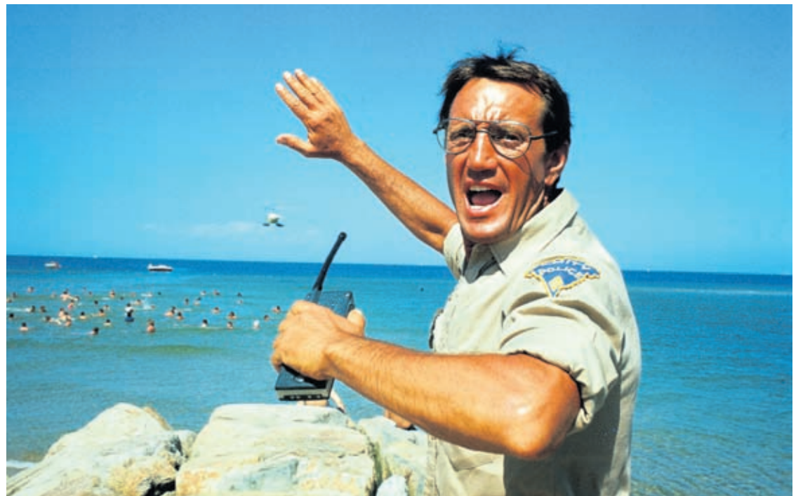
This image released by Universal Pictures shows Roy Scheider in a scene from the iconic 1975 film "Jaws."